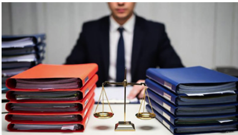
© Générée à l'aide de l'IA

La procédure de filtre exercée par le président de la juridiction disciplinaire constitue un mécanisme central du fonctionnement et de la crédibilité de la justice ordinaire de la profession d'avocat.