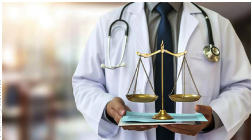
Table ronde dédiée, enquêtes menées localement, actions menées dans les barreaux... Le sujet de la santé des avocats, s'il n'est pas nouveau, prend de l'ampleur dans la profession.