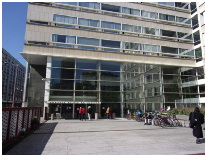
© Éric Messel — Travail personnel, CC BY-SA 4.0

À Lyon, pour la première fois en France, une juridiction se dote d'un organe destiné à recueillir l'avis des « usagers » qui la fréquentent. Inspiré de la pratique des établissements médicaux ou sociaux, ce projet repose sur une approche résolument ouverte de l'institution judiciaire.