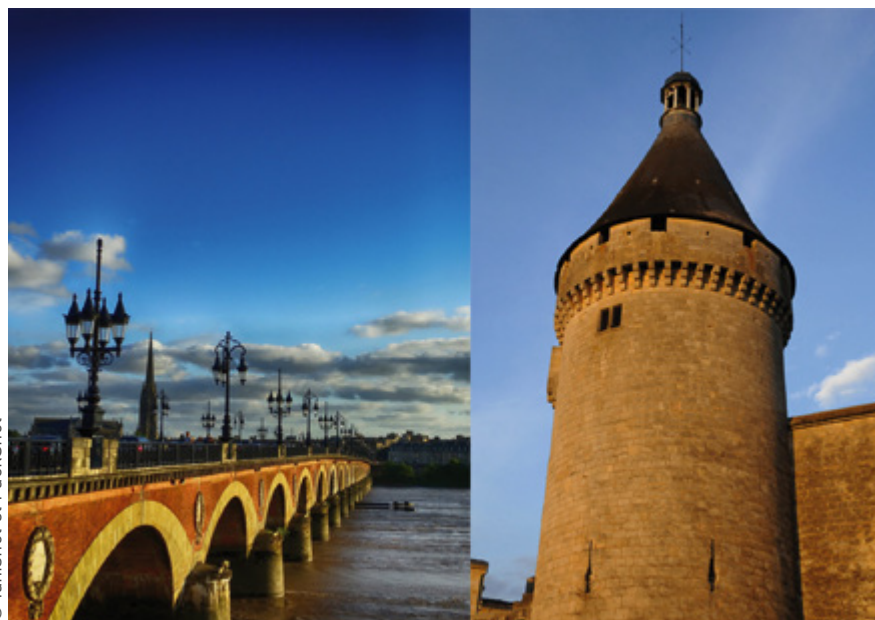
Le pont de pierre à Bordeaux et la tour du Vieux Port à Libourne

Bordeaux la bourgeoise, Libourne la rurale. Au-delà du cliché, les deux barreaux de la Gironde, qui recevront la 7 e convention nationale des avocats du 18 au 21 octobre 2017, partagent une physionomie comparable, une dynamique de croissance, une zone de multipostulation et une CARPA.